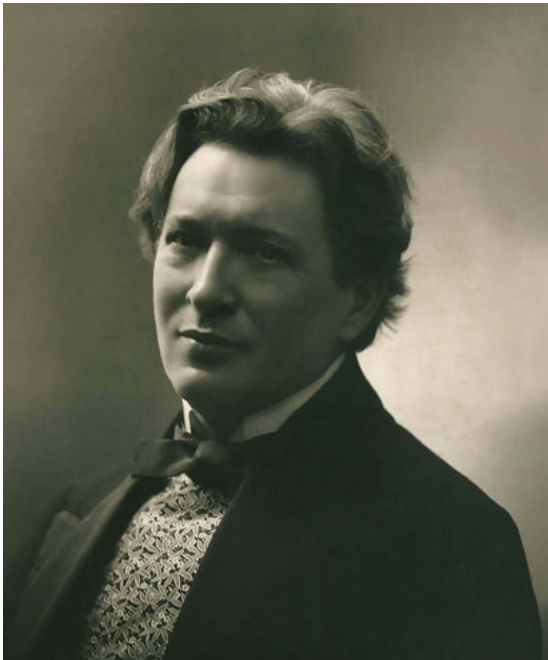
Ferruccio Busoni

drucks; Schmerz und Aufbegehren bleiben wie hinter einem Schleier verborgen. Dass gegen Ende im ätherischen Klanggewand von Celesta und Harfe doch noch eine kurze Streichermelodie aufblitzt, ist nicht mehr als eine Episode. Nach drei Gongschlägen klingt das Stück in ruhigem F-Dur aus. Kein Geringerer als Gustav Mahler verhalf der „Berceuse élégiaque“ zur Uraufführung – bei seinem letzten Auftritt als Dirigent 1911 in New York.