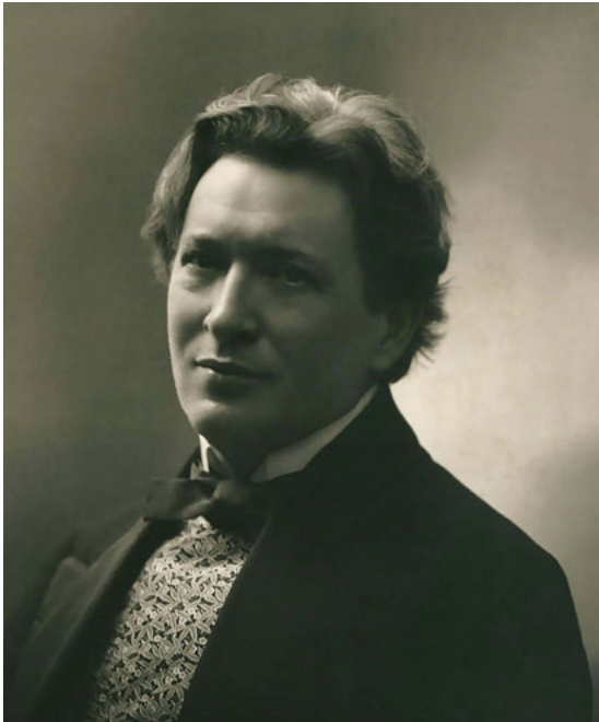
Ferruccio Busoni

drucks; Schmerz und Aufbegehren bleiben wie hinter einem Schleier verborgen. Dass gegen Ende im ätherischen Klanggewand von Celesta und Harfe doch noch eine kurze Streichermelodie aufblitzt, ist nicht mehr als eine Episode. Nach drei Gongschlägen klingt das Stück in ruhigem F-Dur aus. Kein Geringerer als Gustav Mahler verhalf der „Berceuse élégiaque“ zur Uraufführung – bei seinem letzten Auftritt als Dirigent 1911 in New York.