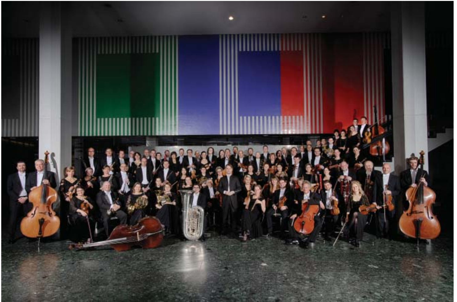
Deutsche Radio Philharmonie