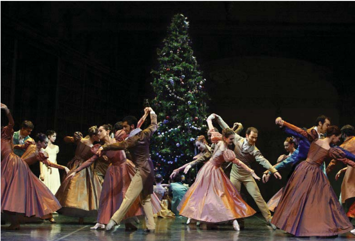
Ballett „Der Nussknacker“

Das Libretto beruht auf E.T.A. Hoffmanns langer und stellenweise unheimlicher Erzählung „Nussknacker und Mäusekönig“. Tschaikowsky und Petipa wählten daraus allerdings nur die leichteren, freundlicheren Motive – denn gerade für den Komponisten war Ballett stets mit der Vorstellung einer glücklich-unschuldigen Kinder-Märchenwelt verbunden.