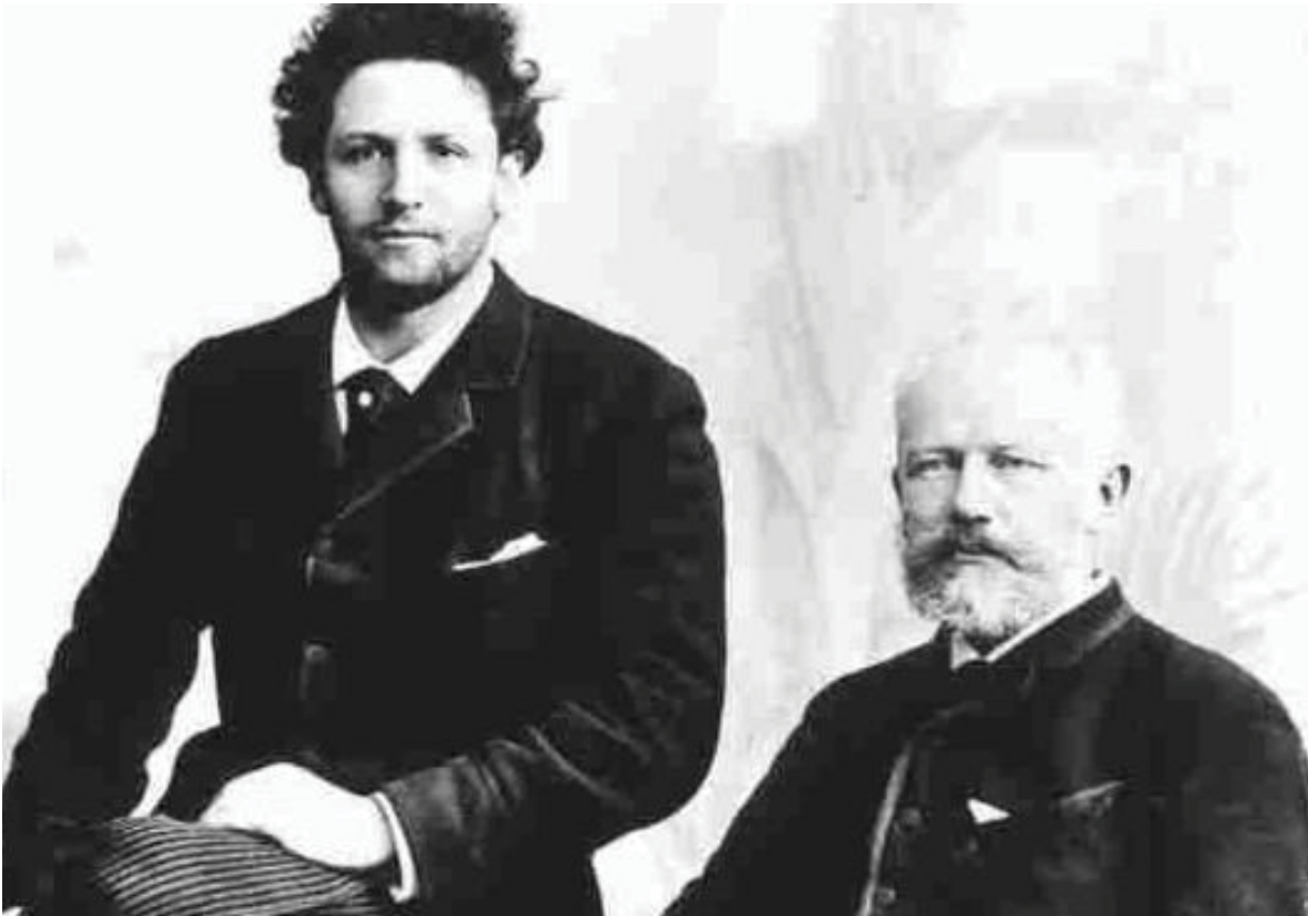
Anatoli Brandukow und Peter Tschaikowsky

Kontrast. Tschaikowsky schrieb das Pezzo capriccioso 1887 für den befreundeten Cellovirtuosen Anatoli Brandukow, einen Schüler Wilhelm Fitzenhagens. Brandukow beriet Tschaikowsky bei der Gestaltung der Solostimme und bestritt gemeinsam mit ihm die Uraufführung der Klavierfassung. Noch bekannter wurde das Stück jedoch in seiner Orchesterversion.