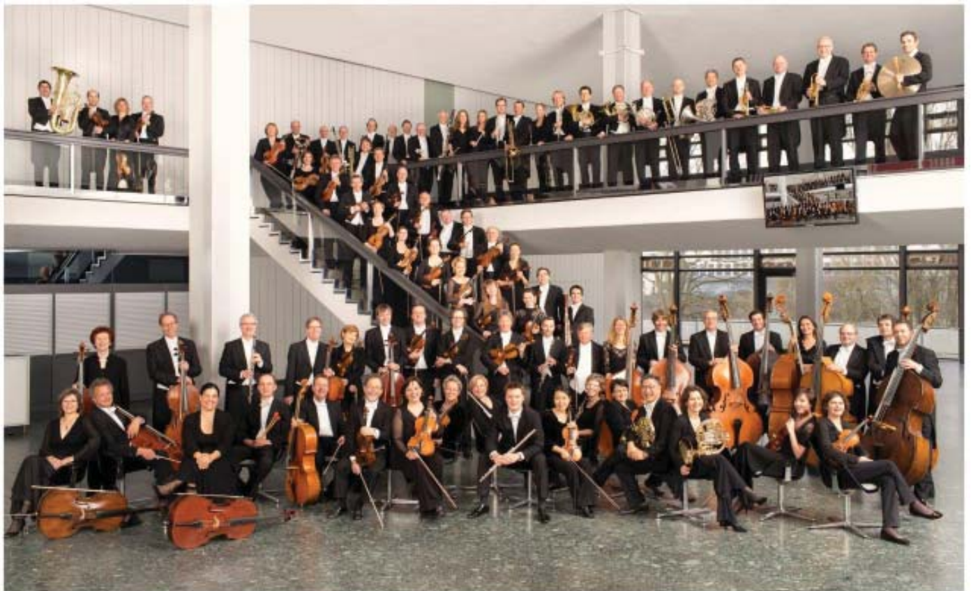
Deutsche Radio Philharmonie